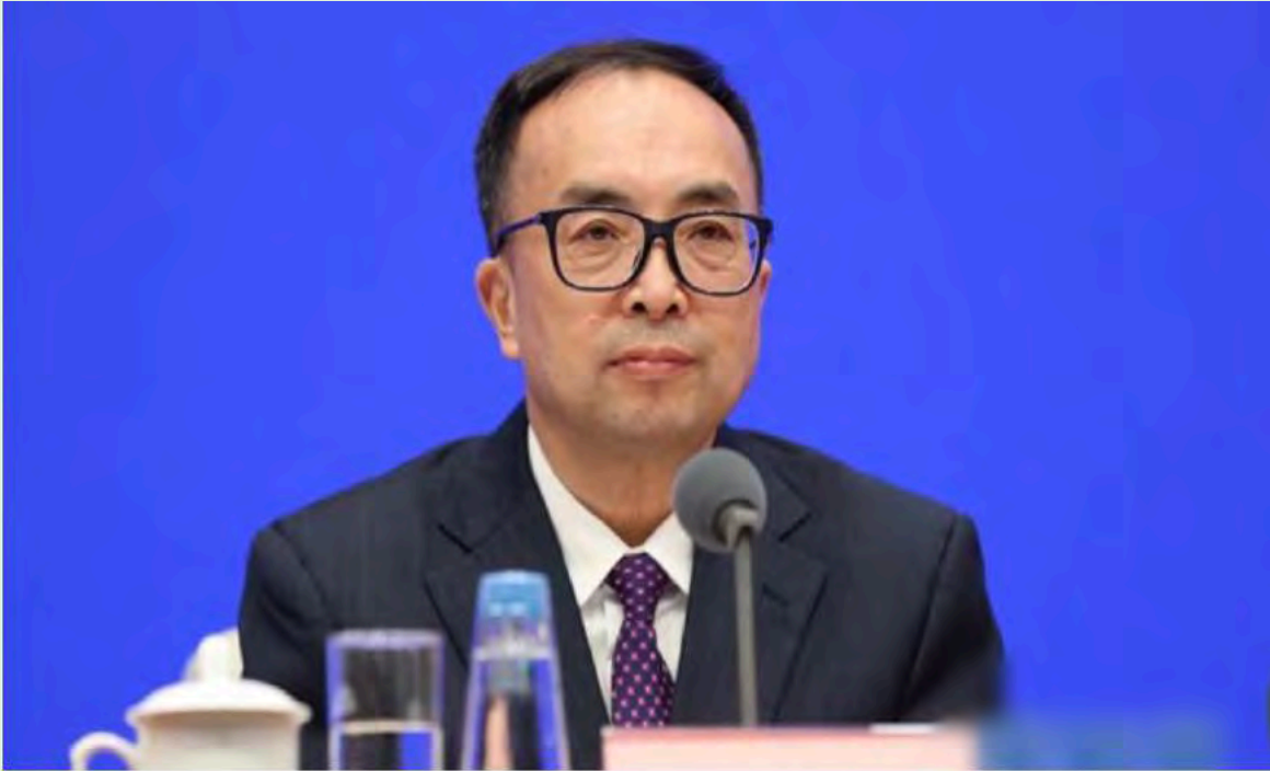
▲ 中國銀保監會首席檢查官王朝弟

中國銀保監會首席檢查官王朝弟今日（21日）表示，9月末銀行業境內不良貸款餘額 3.6萬億元 ，不良貸款率 1.87% 。受疫情衝擊和延期還本付息政策到期影響，不良資產反彈壓力仍然較大，風險可能繼續暴露。